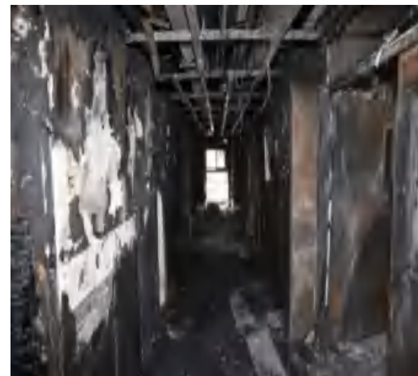
图8 南通道六层墙面过火情况（由东向西）

东楼北通道五层、南通道六层墙面木质装修材料整体过火，吊顶轻钢龙骨变形、石膏板全部脱落；南通道六层内部分房间和管道竖井观察口木门过火、破损严重。（见图7、图8）