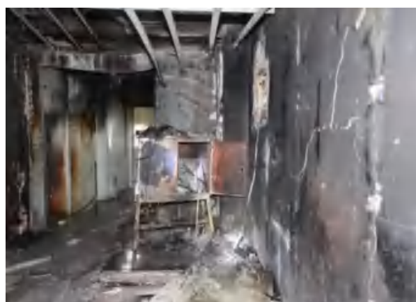
图6 配电箱底部可燃物被烧毁（由西向东）