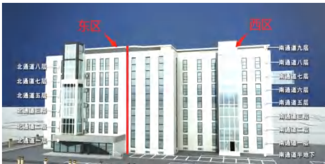
图 1 起火建筑结构示意图(北向南)

米、宽 1.4 米，以下简称北通道)；西区地下一层、地上八层(楼层标号为一、二、三、五、六、七、八、九)，每层设有一条通道(长 38.6 米、宽 1.4 米，以下简称南通道)；南北通道通过楼层中部楼梯间连通。(见图 1、图 2)