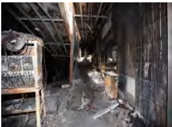
图5 坡道下方可燃物、墙面木质装修被烧毁（由东向西）