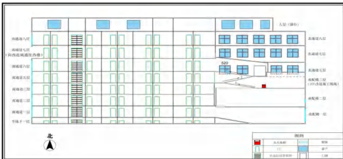
图 2 起火建筑剖面示意图(南向北)