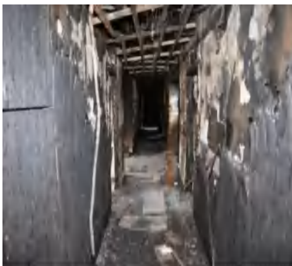
图7 北通道五层墙面过火情况（由东向西）